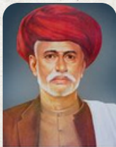
इंग्लीशुर्द महात्मा ज्योतिबा फुले

आदिवासी लोकांच्या संघर्षातून सिद्ध हे होते की, जिथे नैतिक संघर्ष अपयशी ठरले, तिथे प्रत्यक्ष लढा हाच पर्याय ठरला. भारताच्या स्वातंत्र्याला प्रचंड अवकाश बाकी असताना, आदिवासींचा आदिवासींसाठी ब्रिटिश साम्राज्यवादाविरुद्धचा लढा देखील आपल्याला बाबासाहेबांच्या विचारांचे प्रत्यंतर देतो. महात्मा फुलेंचे उदाहरण घेतले तर दिसून येईल की, त्यांनी शोषणाकारी जात व्यवस्थेचा आणि उच्चवर्णीय सर्वण ब्राह्मण वर्चस्वाचा कडाडून विरोध केला. फुलेंनी 'गुलामगिरी' पुस्तकातून वर्चस्वावर आणि सामाजिक शोषणावर थेट प्रहार केला. महात्मा फुले देखील केवळ नैतिकतेच्या आधारावर समाज बदलू इच्छित नव्हते तर, त्यांनी शिक्षण, विचारांची स्पष्टता आणि संघटनांच्या माध्यमातून प्रत्यक्ष संघर्षाचा कठिण मार्ग स्वीकारला. महात्मा फुलेंच्या आयुष्यातील महत्वाचा आणि ऐतिहासिक लढा म्हणजे 'न्हावी'चा संप. न्हावींचा संप हा एक असा ऐतिहासिक लढा होता ज्याने शोषण करणाऱ्या जातिव्यवस्थेला धक्का दिला.